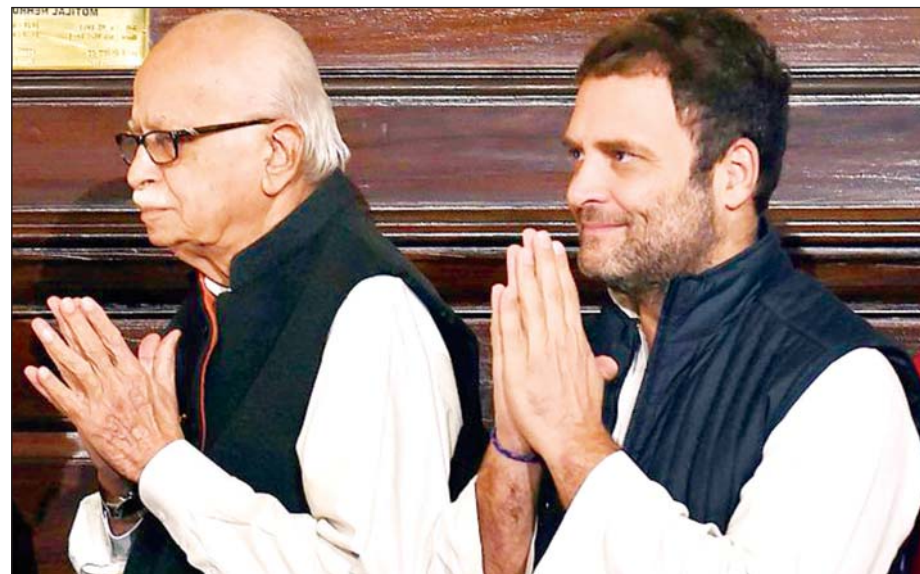
दिल्ली : पूर्व प्रधानमंत्री इंदिरा गांधी की 100वीं जयंती के मौके पर संसद के केंद्रीय कक्ष में एक कार्यक्रम के दौरान भाजपा नेता लालकृष्ण आडवाणी और कांग्रेस उपाध्यक्ष राहुल गांधी।

प्रतिनिधि, 19 नवंबर मुंबई-कांग्रेस नेता पी चिदंबरम ने आगाह किया है कि भ्रष्टाचार के जिन आरोपों ने संग्राम 2 को डुबोया, वैसे ही आरोप अपने कार्यकाल के समापन की ओर बढ़ रही नरेंद्र मोदी सरकार पर भी लग सकते हैं। पूर्व विधानमंत्री ने कहा कि पूर्ववर्ती कांग्रेस नीत संग्राम 2 सरकार पर उसके कार्यकाल के अंतिम दौर में भ्रष्टाचार के कई आरोप लग चुके थे। उन्होंने कहा कि अपने कार्यकाल की समाप्ति वर्ष 2019 में पर यही धब्बा भाजपा सरकार पर भी लग सकता है, हालांकि वह नहीं चाहते कि ऐसा हो।