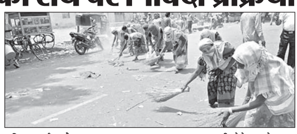
घटित हुई हो, लेकिन स्थायी सभापति अभी भी अपने शब्दों पर कायम रहने से मनपा के स्वास्थ्य विभाग में सिंगल हैड ठेका की निविदा प्रक्रिया संबंधी पूरी तैयारी कर ली है. जिसके अनुसार जिस ठेकेदार की नियुक्ति की जाएगी उसे होटल वेस्टेज, हर घर का कचरा, कंटेनर का कचरा उठाना होगा. इसके अलावा बारिश के मौसम में पानी साफ रखने के लिए ब्लॉचिंग पावडर, औषधियां मच्छरों से निजात के लिए फॉगिंग जैसे कार्य भी करने होंगे. इसके लिए संबंधित ठेकेदार के पास कम से कम सफाई के काम का तीन साल का अनुभव मांगा गया है. यही नहीं इन सभी कामों के लिए आवश्यक मशीनें भी ठेकेदार के पास होनी चाहिए विशेषकर शहर के बड़े 16 व छोटे 17 जगहों की सफाई का काम भी ठेकेदार को करना होगा. ऐसे में ठेकेदार के पास जेसीबी व नालों से कचरा निकालने की मशीनें होनी चाहिए. यह भी शर्त रखी गई है. साथ ही निविदा प्रक्रिया में सिंगल हैड ठेका की उपयुक्तता को भी दर्शाया जाएगा. प्रशासन ने की तैयारी पर अब शहर के भाजपा के बड़े जनप्रतिनिधियों के अनुमति की मुहर लगते ही मनपा निविदा प्रक्रिया शुरू करेगी. ऐसे में जो पाबंद बागी बनकर सिंगल हैड ठेका की प्रतिक्रिया कर रहे हैं, उनके विरोध पर भाजपा के वरिष्ठ जनप्रतिनिधि कितना विचार करेंगे यह देखा जाएगा.

की बिक्री की जाएगी तथा वहीं पर ऑनलाइन आवेदन किया जा सकेगा. इसके लिए छात्रों को शुल्क देना होगा, लेकिन अब तक कम्प्यूटर सेंटर एवं प्रवेश आवेदन का शुल्क निश्चित नहीं किया गया है. 20 प्रतिशत सीटें मैनैजमेंट कोटे के लिए केन्द्रीय पद्धति द्वारा प्रवेश चलाने के पश्चात 20 प्रतिशत जगह मैनैजमेंट कोटे के लिए रखने की संभावना है. महाविद्यालय के विरोध को देखते हुए कुछ जगह मैनैजमेंट कोटे के लिए रखने की तैयारी होने की जानकारी है.