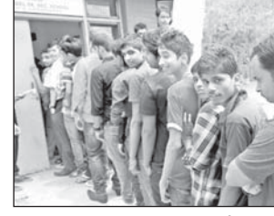
माध्यमिक शिक्षा विभाग काम में जुटा है. कक्षा 10वीं के नतीजे घोषित होने के पश्चात कनिष्ठ महाविद्यालयों में प्रवेश लेने के लिए काफी भीड़ उमड़ती है. प्रतिशत के आधार पर छात्रों को प्रवेश दिया जाता था, इसलिए कई छात्रों को अंक कम होने