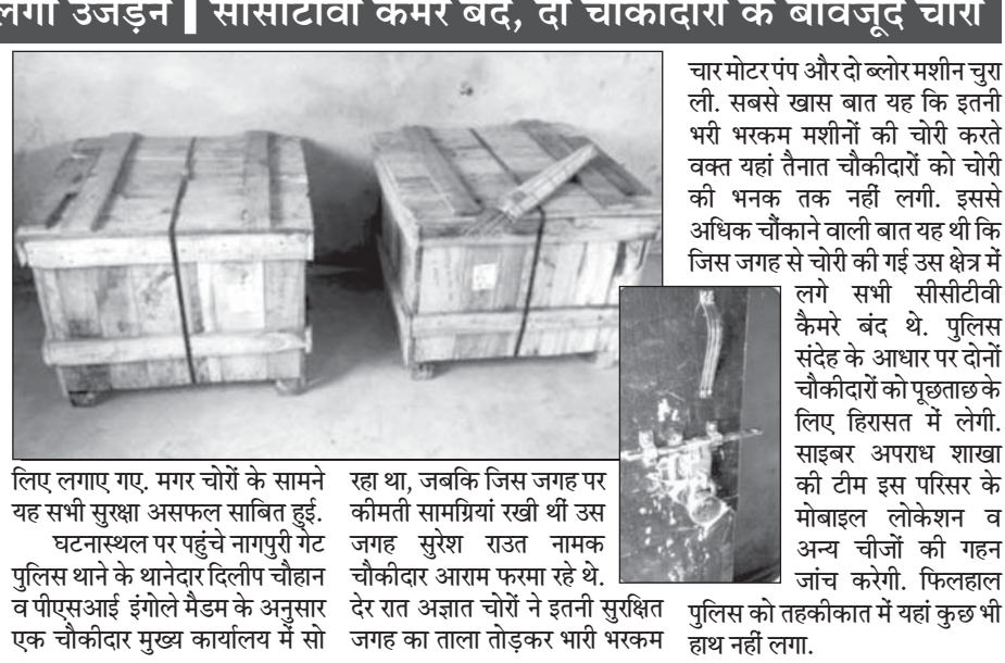
चार मोटर पंप और दो ब्लोर मशीन चुरा ली. सबसे खास बात यह कि इतनी भारी भरकम मशीनों की चोरी करते वक्त यहां तैनात चौकीदारों को चोरी की भनक तक नहीं लगी. इससे अधिक चौकाने वाली बात यह थी कि जिस जगह से चोरी की गई उस क्षेत्र में लगे सभी सीसीटीवी कैमरे बंद थे. पुलिस संदेह के आधार पर दोनों चौकीदारों को पूछताछ के लिए हिरासत में लेगी. साइबर अपराध शाखा की टीम इस परिसर के मोबाइल लोकेशन व अन्य चीजों की गहन जांच करेगी. फिलहाल देर रात अज्ञात चोरों ने इतनी सुरक्षित जगह का ताला तोड़कर भारी भरकम

गांव बसने से पहले लगा उजड़ने | सीसीटीवी कैमरे बंद, दो चौकीदारों के बावजूद चोरी प्रतिनिधि, 25 मई अमरावती - स्थानीय नागपुरी गेट पुलिस थाना क्षेत्र के लालखडी परिसर स्थित मलशुद्धिकरण केंद्र से देर रात लगभग 3 लाख रुपए के 4 मोटर पंप और 3 ब्लोर चोरी कर लिए गए. जबकि घटना के वक्त 2 चौकीदार तैनात थे, लेकिन यहां के सीसीटीवी कैमरे बंद थे. अनुमान लगाया जा रहा था कि इतनी भारी सामग्री चुराने के लिए 6-7 चोरों ने ही हिम्मत जुटाई होगी. फिलहाल पुलिस के हाथों किसी भी तरह का सुराग नहीं लगा. शहर के लिए महत्वपूर्ण मानी जाने वाली मलशुद्धिकरण योजना की इस योजना में करोड़ों रुपयों की सामग्री रखी गई है. यहां पर चौकीदार के अलावा सीसीटीवी कैमरे भी सुख्खा के लिए लगाए गए. मगर चोरों के सामने यह सभी सुख्खा असफल साबित हुई. घटनास्थल पर पहुंचे नागपुरी गेट पुलिस थाने के थानेदार दिलीप चौहान व पीएसआई इंगोले मैसम के अनुसार एक चौकीदार मुख्य कार्यालय में सो