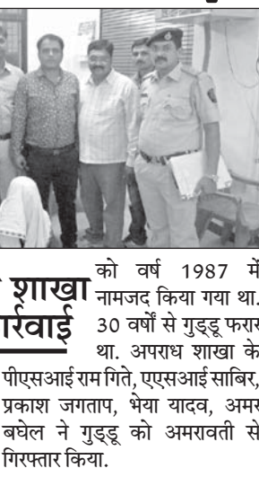
अपराध शाखा की कार्रवाई