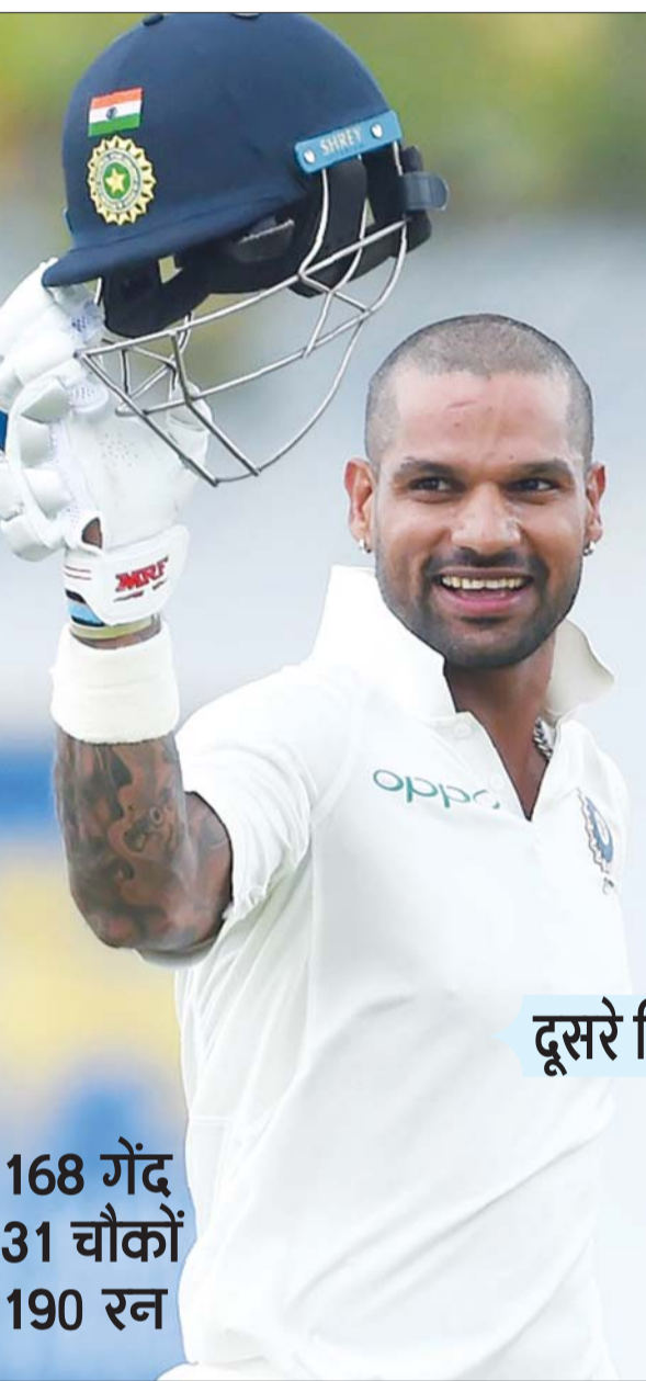
168 गेंद 31 चौकों 190 रन