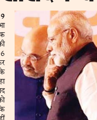
अहमदाबाद, एजेन्सी, 19 नवम्बर - गुजरात विधानसभा चुनावों के लिए बीजेपी ने अब तक कैडिडेट्स की दो लिस्ट जारी की है.