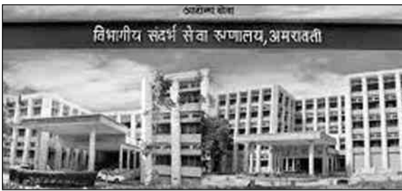
विभागीय संदर्भ सेवा अस्पताल, अमरावती

प्रतिनिधि/प्रतिदिन अखबार अमरावती, 22 फरवरी- विभागीय संदर्भ सेवा अस्पताल (सुपर स्पेशलिटी हॉस्पिटल) के प्रभारी वैद्यकीय अधीक्षक पर निजी लैब चलाने के मामले में स्वास्थ्य प्रशासन की ओर से जांच समिति स्थापित की गई थी. संबंधित जांच समिति की रिपोर्ट प्रस्तुत होने को डेढ़ माह से अधिक की कालावधि हो रही है, किंतु प्रस्तुत की गई जांच रिपोर्ट के अनुसार किसी भी प्रकार की कार्रवाई अभी तक नहीं हुई है. कार्रवाई के संबंध में स्वास्थ्य